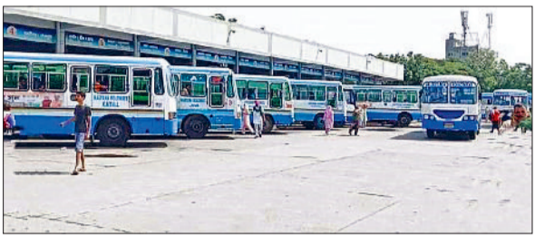
कैथल। बस स्टैंड पर खड़ी बस।

नागरिक को कूपन नहीं दिया जाएगा, क्योंकि इनका रोडवेज बसों में पहले ही आधा किराया लगता है। छूट पर जाने वाली बसों के आगे