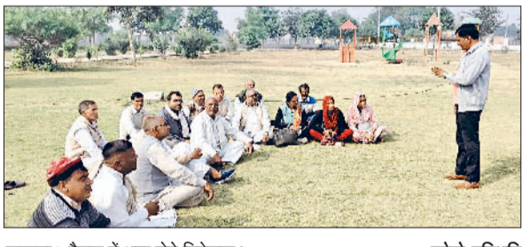
जुलाना। बैटक में भाग लेते निवेशक।

बढ़ा होगा उसकी उसकी चिंता आपने नहीं करनी है। इसके पीछे उन्होंने महाभारत का गीता उपदेश का उदाहरण दिया। इसके बाद स्ट्रेज वन पर आयोजित की प्रतियोगिता में सबसे पहले गुरु डांस, जर्नल सोलो डांस, हरियाणवी फीमेल सोलो डांस, हरियाणवी मेल, क्लासिकल डांस सोलो, हरियाणवी सोलो आदि प्रस्तुतियों की गईं। इन प्रस्तुतियों को प्रदर्शित करने के लिए सभी छात्र व छात्राओं में उत्साह और उमंग देखने को मिली।