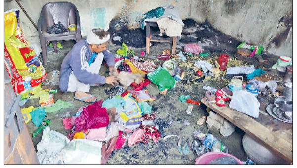
जुलाना। वार्ड चार में आग से जला घर का सामान।

समारोह होगा। गीता महोत्सव को लेकर रोजाना सुबह छह बजे कैथल बस स्टैंड से कुरुक्षेत्र गीता महोत्सव के लिए पहली बस चल पड़ती है।