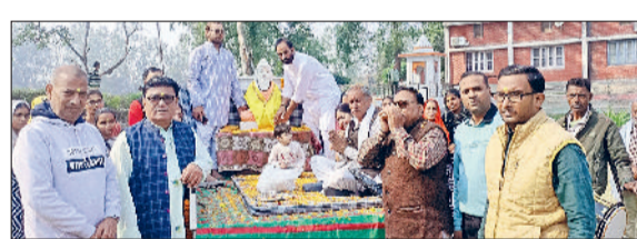
कलायत। नगर में भगवान कपिल मुनि प्रतिमा की शोभा यात्रा

आकर्षक प्रतिभा स्थापना को लेकर विभिन्न कार्यक्रम हुए। इस कड़ी में कॉलेज प्रशासन, शिक्षकों, छात्राओं, शिक्षा समिति सदस्यों व गणमान्य लोगों ने आयोजन में शामिल होकर हवन में पूर्णाहुति डाली। धार्मिक परंपरा का निर्वहन