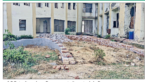
नई बिल्डिंग में आपरेशन थिएटर तक एंबुलेंस पहुंचाने के लिए बनाया जा रहा रास्ता।

लेकिन एनओसी नहीं मिली थी। अब नई और पुरानी दोनों बिल्डिंगों के लिए फायर सेफ्टी के लिए एनओसी ली जाएगी। इसके अलावा अस्पताल के आपरेशन थिएटर तक एंबुलेंस पहुंचे जाएगी। ऐसे में अब नागरिक अस्पताल लोगों के लिए पहले की अपेक्षा ज्यादा सुरक्षित और सुविधाजनक होगा। जॉर्ड में 1975 में नागरिक अस्पताल की बिल्डिंग बनी थी। उस समय यहां 50 बेड की सुविधा थी। अब सात साल पहले नागरिक अस्पताल को एक और नई बिल्डिंग मिली। इसमें 200 बेड की सुविधा